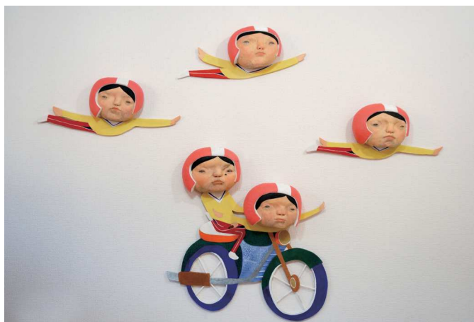
集団登校 2021 樟、板、アクリル絵具