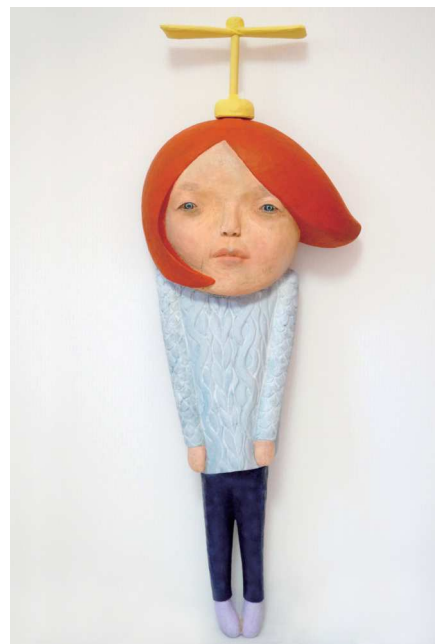
きつと、うまくいく 2019 樟に彩色