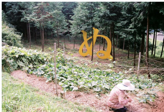
林に、ぬ 2012 コンクリートパネル、ペンキ