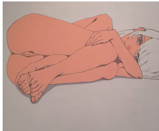
「拡張」2019 1620x1940mm キャンバスにアクリルガッシュ