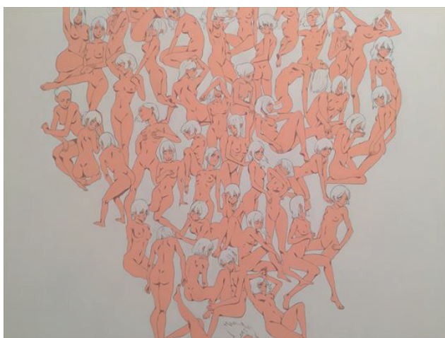
「拡張」 2019 1620x1940mm キャンバスにアクリルガッシュ

少女や女性をモチーフに、人間の精神の脆さや儚さを描いています。 今回の展覧会では女性へのフェティシズムを主張するだけでなく 現代の世界情勢に対するメッセージも発していきたいと思えます。