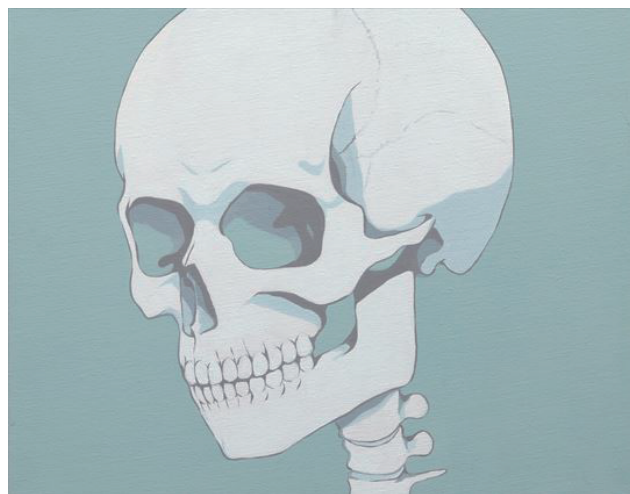
「メメントモリ」 2019年 318x410mm、 キャンバスにアクリルガッシュ