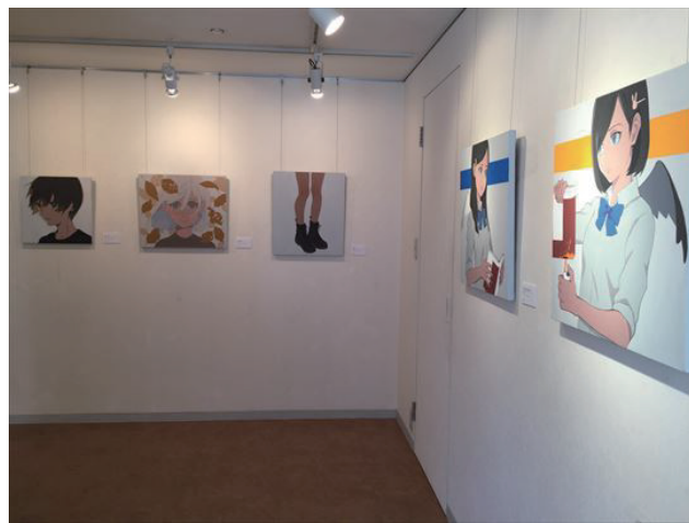
個展「I'm so happy」(2019) 展示風景より