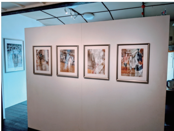
個展「表層を観測する」(2021) 展示風景

「箱の中に帰す」は 2m×6m30cm の作品である。そのため、ハンドスキャナーの解像度では大きさに耐えることができない。解像度の低さは近くで見ることの曖昧さを示し、皮膚という体の内外のインターフェースの機能性と情報の含有量をイメージさせることを試みた。「箱の中の猫<身体>を、観測<表示>する時」と比較して、物質として展示をすることで、制作を通じた身体と情報の分解行為となり、皮膚という人間の表層的器官を観測することができる。