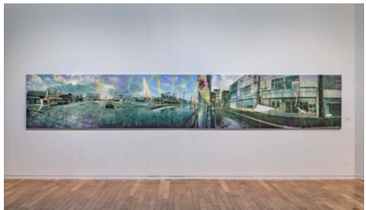
もちゆくもの 2020年 キャンバスにインクジェットプリント、漂白剤 1000×6000mm