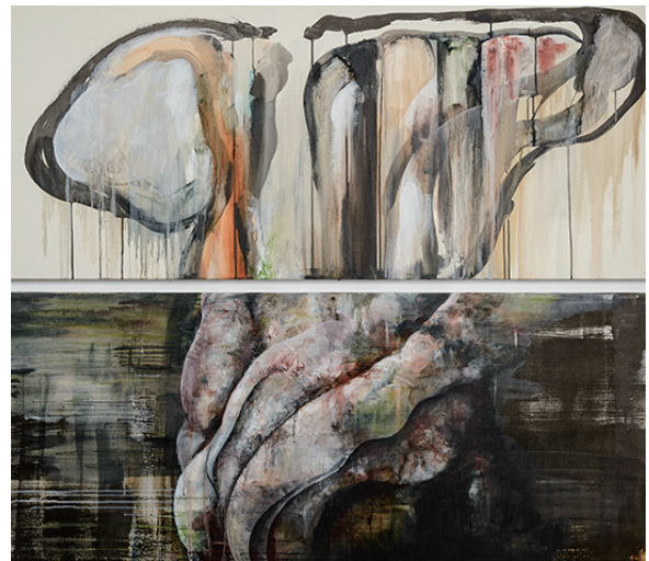
start 2020 キャンバスに油彩、墨汁 1455×605 mm ×2点