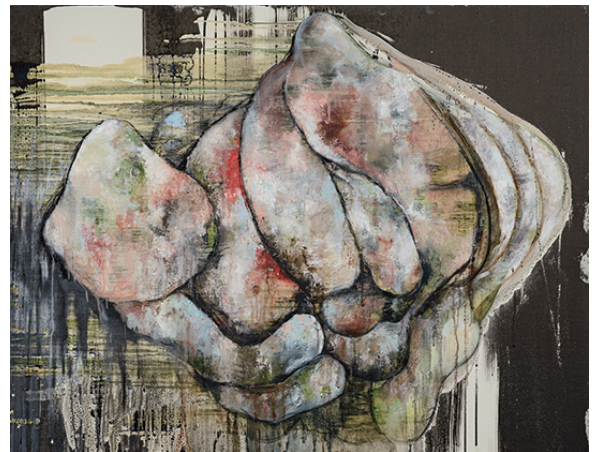
colors 2020 キャンバスに油彩、墨汁 1167×910 mm