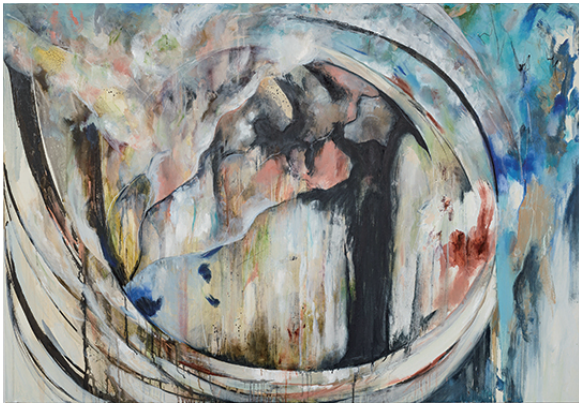
not found 2020 キャンバスに油彩、墨汁 1620×910 mm

私の制作のコンセプトとなる「選択」という行為の成果物である作品にはきっとそれぞれ個性がある。 1つの対象物。私が見るそれと他者が見るそれは同じではないのだろう。 同じものを見ていてもこれまでの各々の選択やそれにより生じた考え方によって、多くの分岐が生まれる。 どう見えるか。どう見たいのか。 結局自分の中にしか答えはない。答えを作るのが自分なのだ。