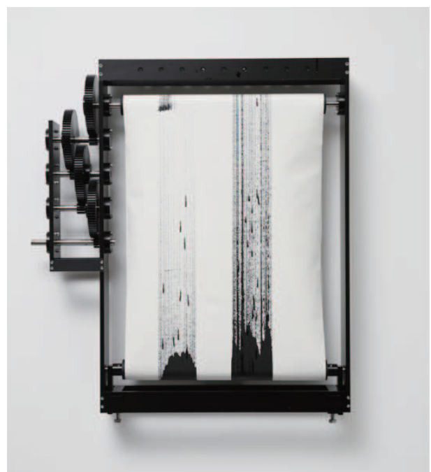
円を描くⅣ 2020 アルミニウム、鉄、ステンレス