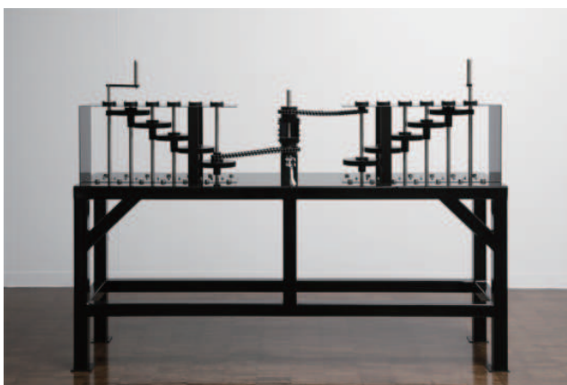
円を描くⅢ - マシン 2020